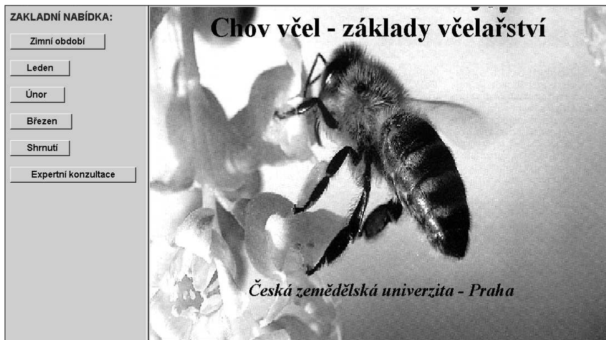
Obr.1 – Úvodní obrazovka realizovaného e-learningového kurzu na PEF CZU

E-learning pro chovatele včel může nabídnout nejen začínajícím včelařům dostupný a kvalitní zdroj celoživotního sebevzdělávání obsahující nejnovější poznatky, metody a techniky včelařství. Rovněž tak lze umožnit možnost ověření stupně osvojení studované teorie při řešení simulovaných problémových situací včetně možnosti konzultace případných problémů, které doprovázejí provozování vlastní aktivity. Takovéto konzultace prostřednictvím vnořeného expertního systému budou mít vysokou odbornou kvalitu a budou poskytovány včas, tak aby bylo možno zjednat účinnou nápravu.