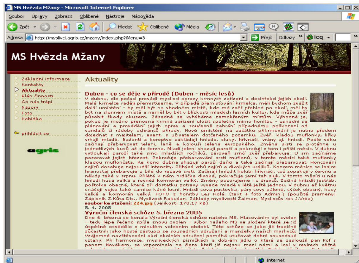
Obr. 2: Ukázka internetových stránek zájmového sdružení MS Hvězda Mžany

Téměř roční zkušenosti s fungováním projektu dávají prostor ke shrnutí největších problémů se širším uplatněním internetové formy prezentace zájmových aktivit na venkově. Určitá část limitujících faktorů je technického rázu, kam lze zařadit nedostatečnou znalost možností internetu popř. počítačovou negramotnost. Přesto lze konstatovat, že v každé zájmové skupině na venkově působí alespoň jeden člověk znalý práce v internetovém prostředí a schopný tvořit podle podrobných šablon vlastní webovou stránku. Prezentace aktivit různých zájmových skupin na venkově naráží na řadu dalších úskalí jako je nezvyk prezentovat svou činnost právě na internetu, u některých skupin se jedná snad dokonce o strach prezentovat některé body své činnosti na veřejnosti. Řada lidí hledá smysl prezentace a pochybuje, zda vyvinutá činnost bude mít dostatečnou odezvu i u dalších zájmových skupin. Existuje také široká skupina lidí, kteří u této dobrovolné aktivity hledají ekonomický profit a pokud jej nenacházejí, jejich zájem prudce upadá.